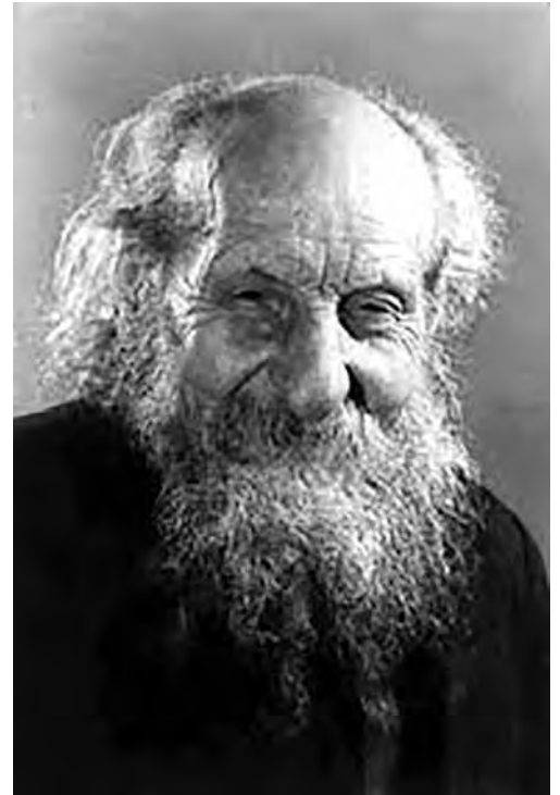
Padre Carlo Crespi

«Non resta che attendere con fiducia il sapiente giudizio della Chiesa», commentano, con soddisfazione e speranza, gli amici di Padre Carlo Crespi dalla onlus che hanno costituito con lo scopo di diffondere su questo territorio la conoscenza della sua figura e delle sue opere. Tra le tante attività di cui l'associazione (di cui fa parte anche un nipote del sacerdote legnanese) si è fatta promotrice, vale la pena di ricordare la mostra che era stata allestita nel 2016 all'interno della chiesetta di Santa Maria della Purificazione, la realizzazione di un volume, le conferenze e i momenti di preghiera, le raccolte fondi per supportare le adozioni di bambini in Ecuador