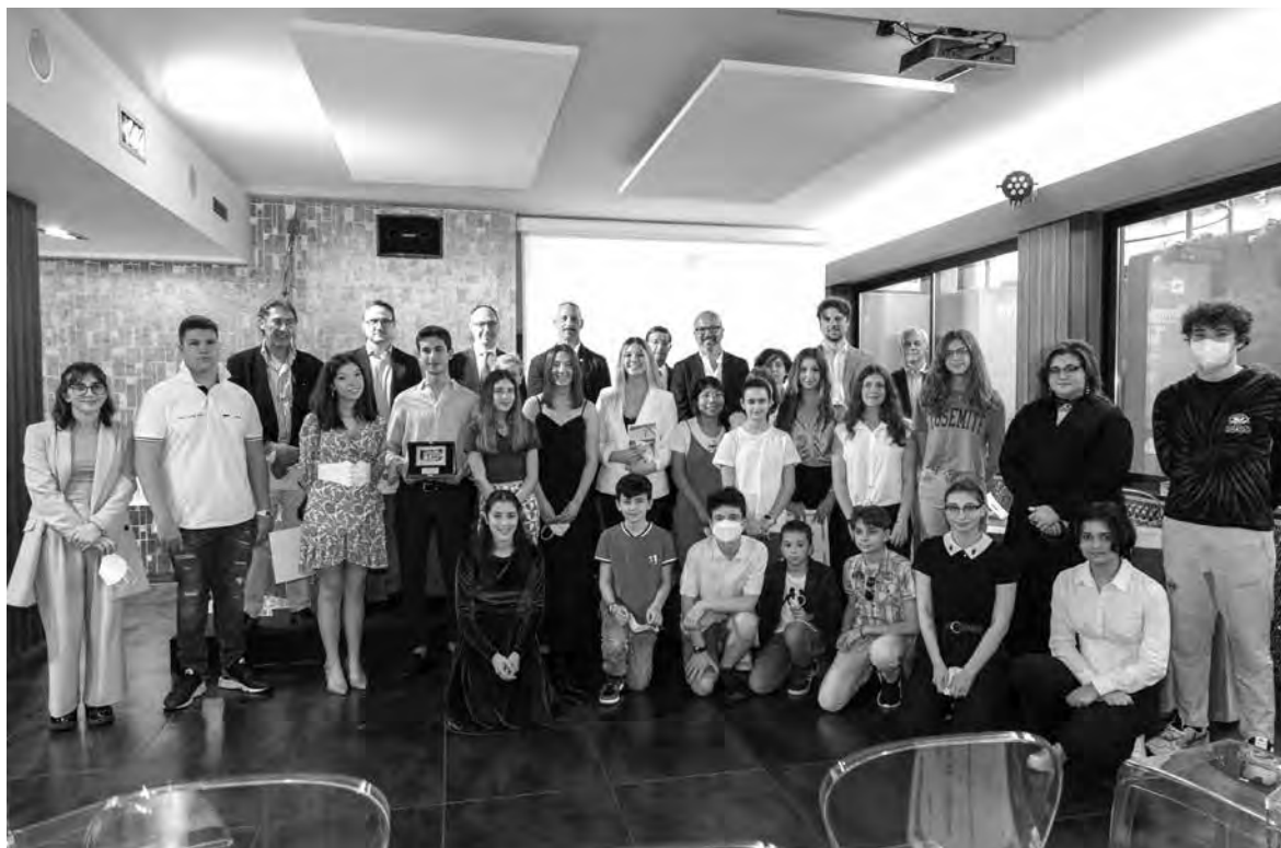
Foto di gruppo con i vincitori

Mariapia Garavaglia presidente della Fondazione Palio