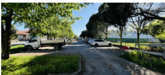
Vista prima dell'intervento - parcheggio via XXIV Maggio