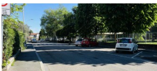
Vista prima dell'intervento - via Don Magni