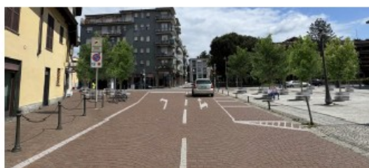
Vista dopo l'intervento - Piazza Italia