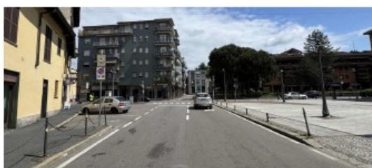
Vista prima dell'intervento - Piazza Italia