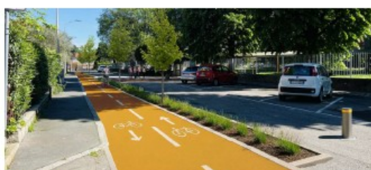
Vista dopo l'intervento - via Don Magni