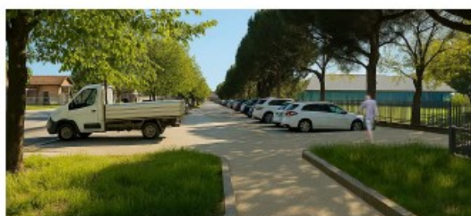
Vista dopo l'intervento - parcheggio via XXIV Maggio

This entry was posted on Friday, October 31st, 2025 at 5:05 pm and is filed under Alto Milanese . You can follow any responses to this entry through the Comments (RSS) feed. You can skip to the end and leave a response. Pinging is currently not allowed.