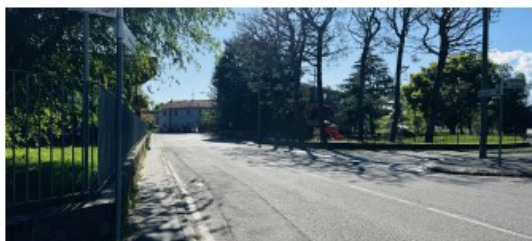
Vista prima dell'intervento - via XXIV Maggio