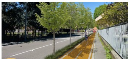
Vista dopo l'intervento - via XXIV Maggio