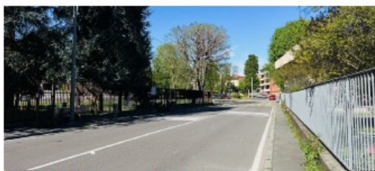
Vista prima dell'intervento - via XXIV Maggio