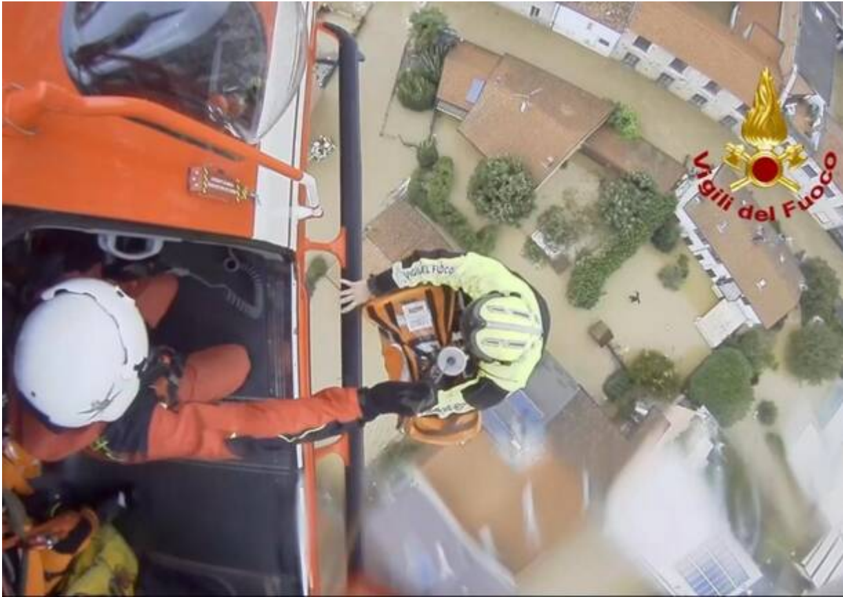
Soccorsi sopra la Brianza allagata, a Lentate sul Seveso