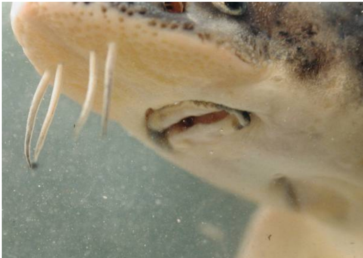
Storione cobice, particolare del muso

dalla sfuggente e curiosa Lampreda padana ( Letentheron zanandreaei ), del gruppo dei Petromizonti, vertebrati acquatici con corpo cilindrico, scheletro cartilagineo e bocca a ventosa, all'esigente Rana di lataste ( Rana latastei ), con abitudini per lo più forestali in boschi umidi ai margini del fiume e delle zone umide, ma dipendente da stagni e raccolte di acqua pulita per la riproduzione ed i primi anni di vita, accompagnata da un'altra rana rossa, la Rana agile ( Rana dalmatina ) e dall'arboricola Raganella italiana ( Hyla intermedia )".